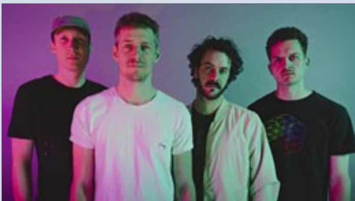
VIVA LA VIDA