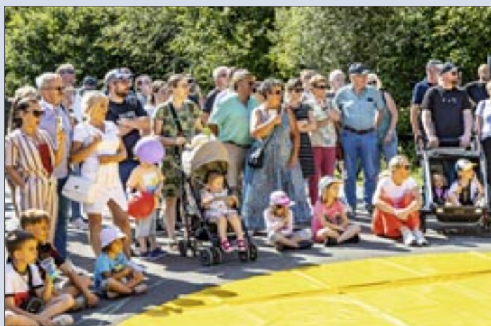
Gauklerbühne an der Seepromenade

An der Bosener Mühle werden für Kunstinteressierte am Samstag ab 14 Uhr Schmiedearbeiten sowie Live-Vorführungen an der Bildhauerhütte präsentiert. Am Sonntag findet ab 9 Uhr ein Kunstschmiede-