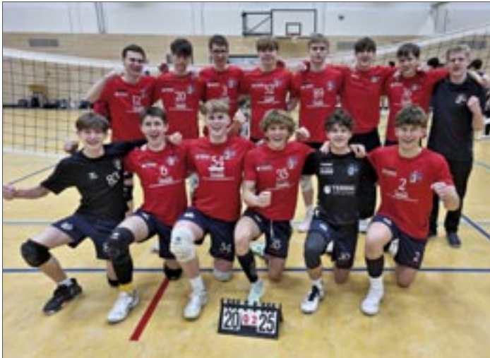
U20 TV Bliesen 2026

Saarbrücken/Bliesen. Das Teilnehmerfeld für die Deutsche Volleyball Meisterschaft der U20 männlich (9./10. Mai) am Sportcampus Saar in Saarbrücken steht fest: 16 der besten Nachwuchsteams Deutschlands werden an diesem Wochenende um den Titel kämpfen – darunter zahlreiche bekannte Namen aus der Volleyball-Bundesliga sowie traditionsreiche Vereine mit starker Nachwuchsarbeit.