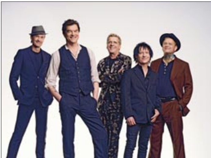
Die Toten Hosen