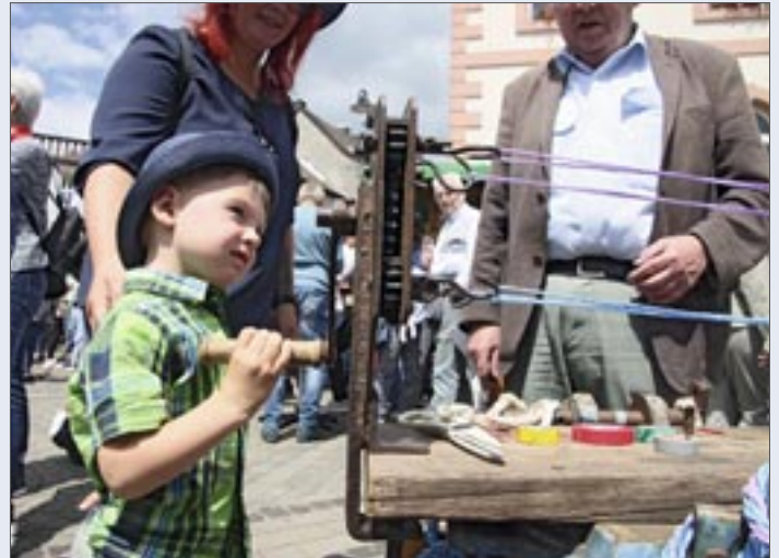
... und staunen

Historische Landmaschinen, traditionelles Handwerk und Live-Musik sorgen für ein abwechslungsreiches Markterlebnis.