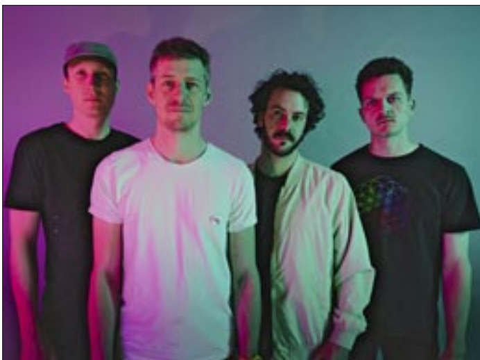
Viva La Vida