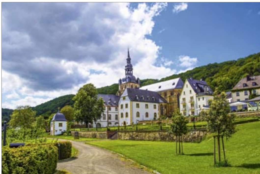
Blick auf die Abteikirche in Tholey

Alle Führungen haben eine Dauer von etwa 90 Minuten. Aufgrund der begrenzten Teilnehmerzahl ist eine vorherige Anmeldung über die Webseite www.tholey.de/abteifuehrungen erforderlich.