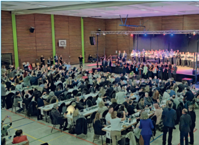
Blick in die gut gefüllte Halle