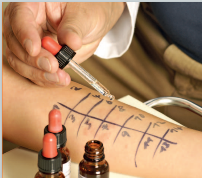
Beim Prick-Test werden meist auf dem Arm des Patienten verschiedene Allergene aufgetragen und die Haut an den jeweiligen Teststellen danach minimal eingeritzt. Dann wartet der Arzt 20 Minuten ab – um danach zu schauen, ob es an den Testpunkten zu allergischen Reaktionen gekommen ist. Sie schauen meist aus wie quaddelartige Mückenstiche.

Bei schweren Allergien kommen die Patienten um Tabletten nicht herum. Sie müssen diese in der Regel während der gesamten Pollenflug-Saison einnehmen. Daneben gibt es eine zweite sehr wichtige therapeutische Säule: kortisonhaltige Nasensprays. Sie lindern die Entzündungsreaktionen an den Schleimhäuten. Diese Sprays können jedoch nur richtig wirken, wenn