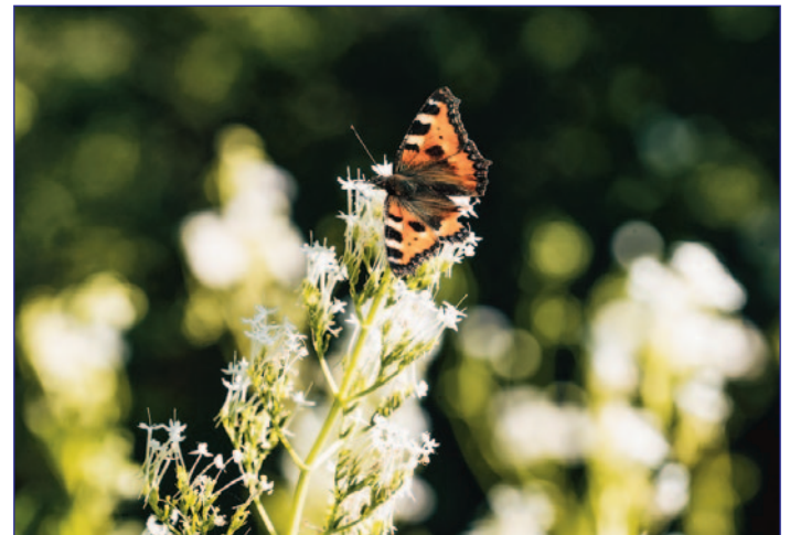
Kinderworkshop „Schmetterlingshäuser bauen“