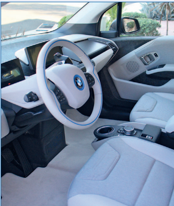
Auto innen tip-top! Da macht das Fahren so richtig Spaß ...

Nachdem Sie das Auto gründlich vorge-reinigt haben und alle Sitze sowie Fugen sauber sind, geht es an die Reinigung der Kunststoffteile im Fahrzeug. Besonders gründlich lassen sich die Armaturen mit einem Mikrofasertuch und warmem Wasser säubern. Tunken Sie das Tuch zunächst in das warme Wasser, wringen es gut aus, damit es nicht mehr tropft und reinigen anschließend die Kunststoffpartien. Nach und nach reinigen Sie so auf diese Weise alle Oberflächen. Wichtig ist, das Tuch zwischendurch immer wieder im Wasser auszuspülen, damit das Auto wirklich sauber und der Staub nicht nur verteilt wird. Halten Sie bei der Reinigung mit dem feuchten Tuch Abstand von elektronischen Teilen und nutzen für die Säuberung dieser lieber einen Pinsel oder ein trockenes Tuch. Gerade die Luftdüsen des Fahrzeugs lassen sich sehr gut mit einem Wattestäbchen vom Schmutz befreien. Handelt es sich um besonders hartnäckige Flecken, können Sie in das warme Wasser auch ein wenig Spülmittel hinzugeben.