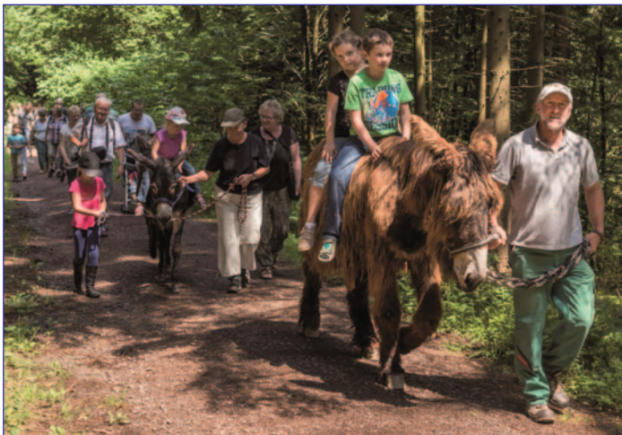
Erlebniswanderung mit den Eseln

Weitere Infos sowie Tickets gibt es im Ticketshop der Tourismus- und Kulturzentrale des Landkreises Neunkirchen unter www.finkenrech.de .