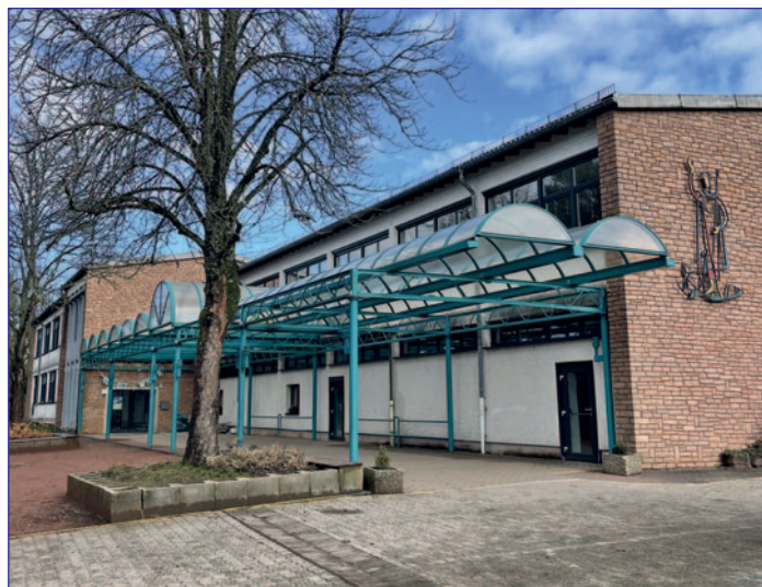
Die Rothenbergschule in Dirmingen

WVO konnten die Anschaffungskosten und die Wartung im ersten Jahr vollständig gedeckt werden. Die laufenden War-