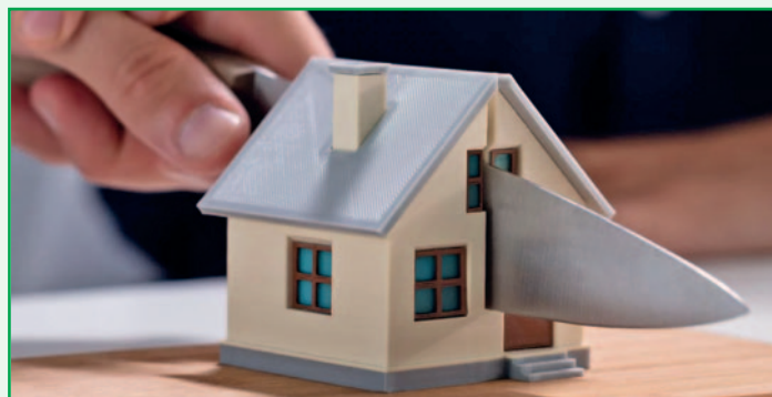
So weit muss es nicht kommen: Regeln Sie schon vor dem Erwerb Ihrer Immobilie, was im Falle einer Trennung mit Kredit und Immobilie passieren soll!

*Wohn-Riester ist eine staatlich geförderte Form der Altersvorsorge, die den Kauf, Bau, Entschuldung oder altersgerechten Umbau einer selbstgenutzten Immobilie in der EU finanziell unterstützt. Sparer erhalten Zulagen (175 € Grundzulage/Jahr, bis zu 300 € pro Kind/Jahr) und Steuervorteile, um mietfreies Wohnen im Alter zu ermöglichen. Vorausgesetzt, Sie bewohnen die Immobilie selbst und sind Eigentümer:in. Doch Vorsicht: die hier erworbenen Zinsen müssen bei Renteneintritt nachversteuert werden und bei Verkauf, Vermietung oder Aufgabe der Selbstnutzung vor Rentenbeginn müssen die erhaltenen Zulagen und Steuervorteile zurückgezahlt werden.