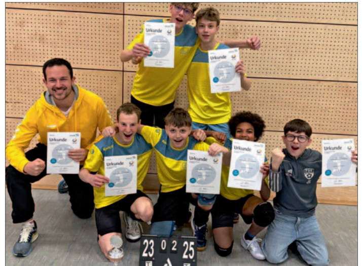
Mannschaft des Gymnasiums Ottweiler

Auch in der Wettkampfklasse III konnte sich ein Team mit TV-Bliesen-Spielern durchsetzen: Die Mannschaft des Gymnasiums Ottweiler gewann ebenfalls das Landesfinale und löste damit das Ticket zum Bundesfinale.