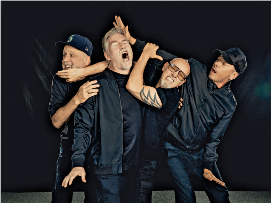
Mumpi Künstler @ Monsterpics

Die Hip-Hop-Legenden sind zurück. Konzert im Rahmen der „DIE FANTASTISCHEN VIER – DER LETZTE BUS – SOMMER OPEN AIRS 2027 – FINAL TOUR 26-28“ am 28. August 2027 im ehemaligen Bosenbachstadion der Kreisstadt.