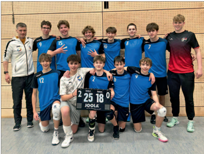
Mannschaft des Gymnasiums Wendalinum

Großer Erfolg für den Volleyballnachwuchs des TV Bliesen: Gleich zwei Schulmannschaften mit zahlreichen Spielern aus der Jugendabteilung des Vereins haben beim Landesfinale des Schulwettbewerbs „Jugend trainiert für Olympia“ im Saarland den Landestitel gewonnen. Sowohl das Team des Gymnasiums Wendalinum in der Wettkampfklasse II als auch die Mannschaft des Gymnasiums Ottweiler in der Wettkampfklasse III sicherten sich den Sieg und qualifizierten sich damit für das Bundesfinale in Berlin, das vom 5. bis 9. Mai stattfindet.