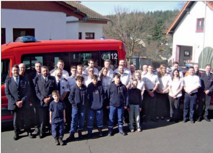
Alle waren vor den Fahrzeugen angetreten.

Die Einsatzabteilung der Freiwilligen Feuerwehr Löschbezirk Braunshausen, Gemeinde Nonnweiler, besteht aktuell aus 28 Aktiven; sechs Jugendliche gehören der Nachwuchsorganisation an.