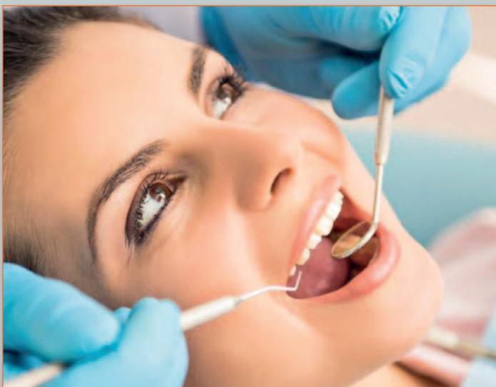
Mindestens 2 Mal im Jahr zum Zahnarzt – für ein „gutes Lachen“!