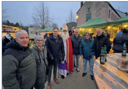
Adventsmarkt in Humes

In Humes zeigte sich einmal mehr, was unser Ort so besonders macht: das großartige Miteinander der Vereine. Der Adventsmarkt wurde – wie in jedem Jahr – von den örtlichen Vereinen gemeinschaftlich aufgebaut, organisiert und am Ende auch wieder abgebaut. Beteiligt waren der Theaterverein Saargold, der Gesangsverein Humes, der TV Humes, der Schützenverein Humes, die Betze-Bummler, der Freizeit Club, die Freunde