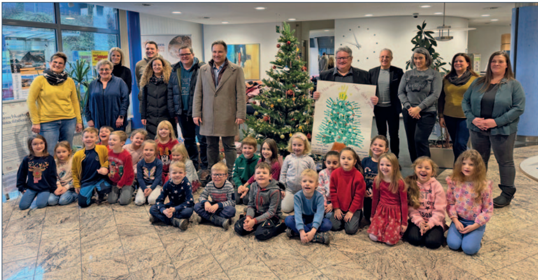
Die Kinder des Kinderhauses St. Josef Eppelborn begleiteten die Geschenkeübergabe der Wunschbaumaktion mit Weihnachtsliedern.

levoBank und Kindernothilfe Saar e.V. erfüllten zu Weihnachten Kinderwünsche