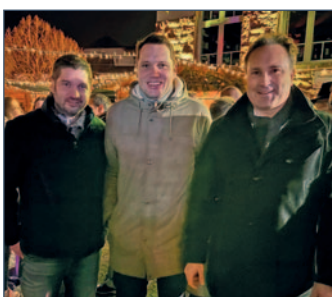
Weihnachtsmarkt an der Koßmannschule

Besonders erfreulich: Der gesamte Erlös des Weihnachtsmarktes wird wie in jedem Jahr gespendet – ein starkes Zeichen der Solidarität in unserer Gemeinde.