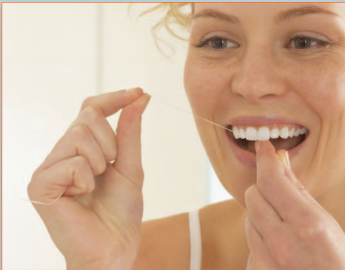
Zahnseide – gegen Bakterien in den Zahnzwischenräumen

der Bürste. Fluoridierte Zahnpasta verringert nachweislich die Neubildung von Karies. Zahncremereste nach dem Putzen nur mit wenig Wasser ausspucken! So bleibt die Schutzwirkung des Fluorids erhalten.