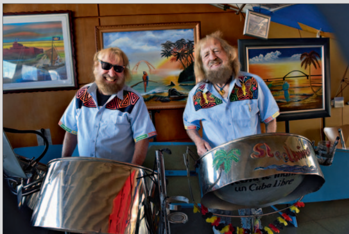
Die legendären Charchulla-Zwillinge, Pioniere des Surfsports, in ihrem Museum auf Fehmarn

Mit Peter Gebhard und dem T1-Bulli "Erwin" 18.000 Kilometer rund um Deutschland