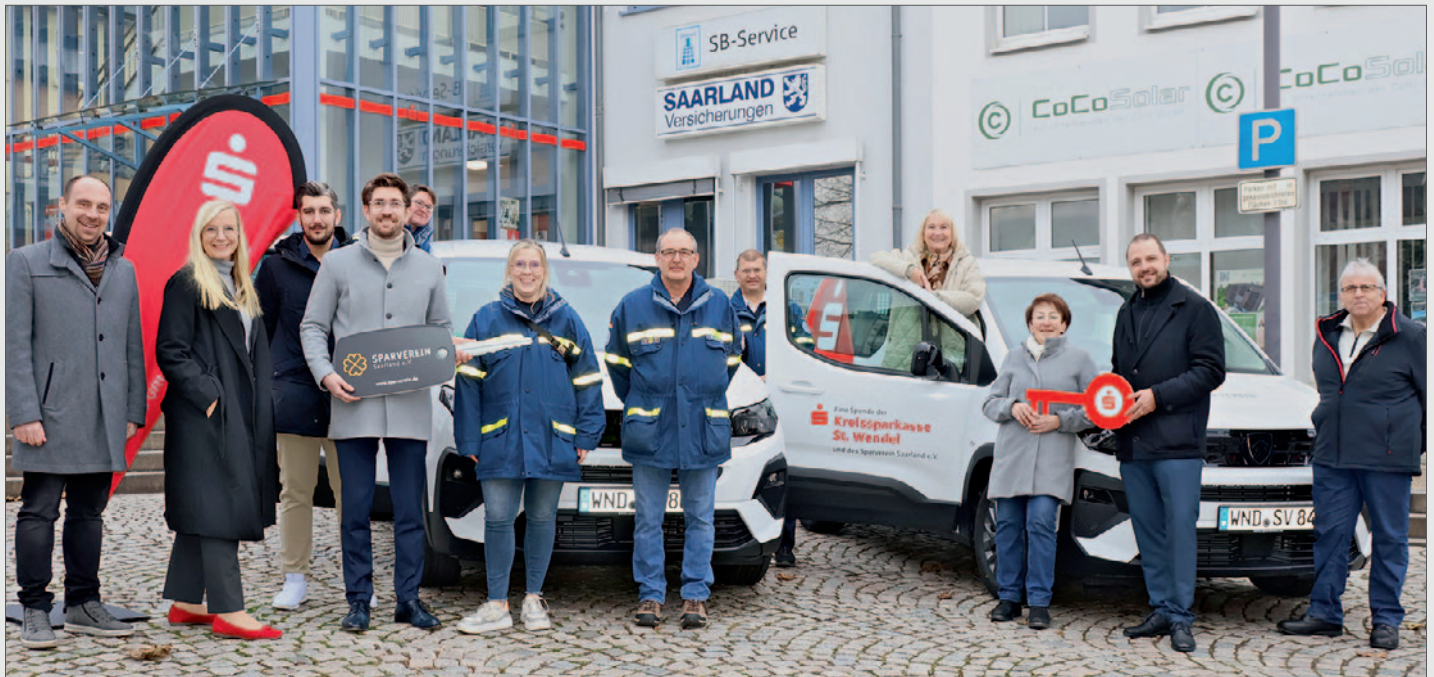
Zwei nagelneue Peugeot Rifter des Sparverein Saarland wurden bei der Kreissparkasse St. Wendel an die Helfenden Hände und die THW-Helfervereinigung Theley übergeben.

Spendenfahrzeuge von der Kreissparkasse an Hilfsorganisationen übergeben